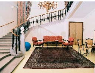
Im Rudolfinerhaus erleben Patienten die einzigartige Symbiose einer modernen Privatklinik mit dem Ambiente eines 5-Sterne Hotels.

Abgesehen davon, dass der Patientenakt in Papierform immer nur von einer einzelnen Person eingesehen werden konnte, war auch noch das Platzproblem zu lösen. Denn bei einer gesetzlichen vorgeschriebenen Aufbewahrungszeit von 30 Jahren für Krankengeschichten wuchs der Platzbedarf im Archiv stetig.